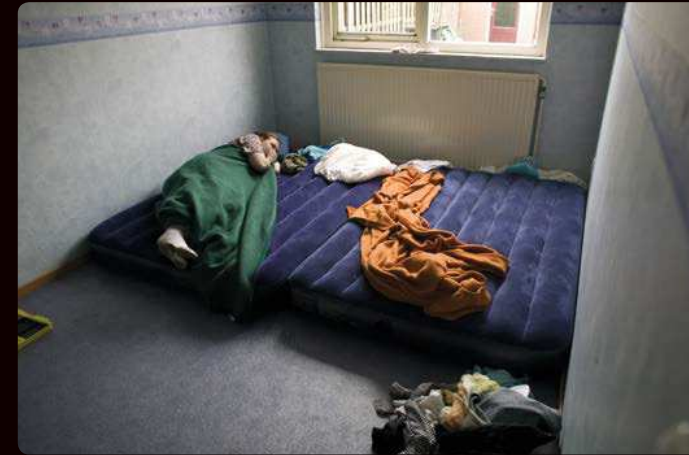
Moeder, dochter en zoon slapen alle drie op luchtbedden onder dunne dekens. De lakens gebruiken ze als gordijnen.