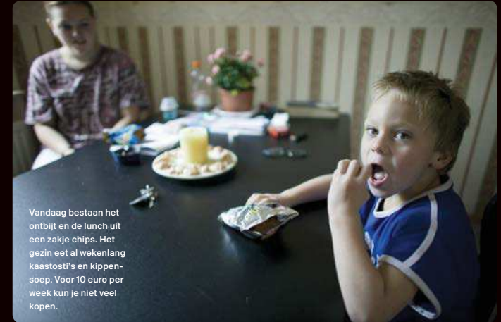
Vandaag bestaan het ontbijt en de lunch uit een zakje chips. Het gezin eet al wekenlang kaastosti's en kippensoep. Voor 10 euro per week kun je niet veel kopen.